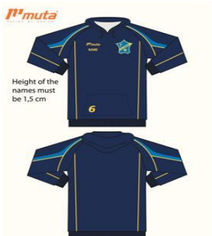
10723 KC Harich