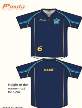
10723 KC Harich