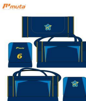
10723 KC Harich