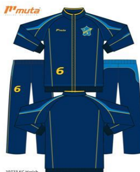
10723 KC Harich